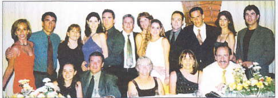
Integrantes de las familias Hoz de Vila y Canelas.