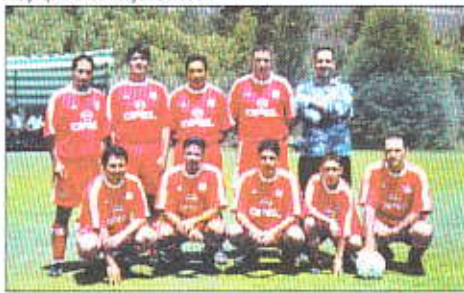
Equipo de "Bayern"