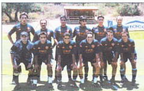
Equipo de "Virmegraf"

Se está desarrollando el Torneo de Fútbol 8 auspiciado por Móvil de Entel en la Modalidad "todos contra todos". Clasificaron para semifinales del grupo 1 a Barcelona con 9 puntos, Virmegraf con 6 puntos; del Grupo 2 Bayern con 6 puntos, Pumas con 4 puntos. En la eliminatoria se anotaron 114 goles y quedó como goleador Gerardo Gil del Barcelona. La final se jugará el domingo 18 de Nov.