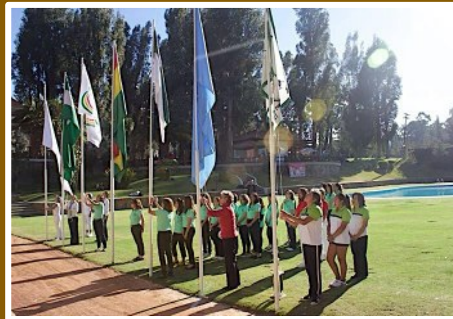
Participantes del Campeonato